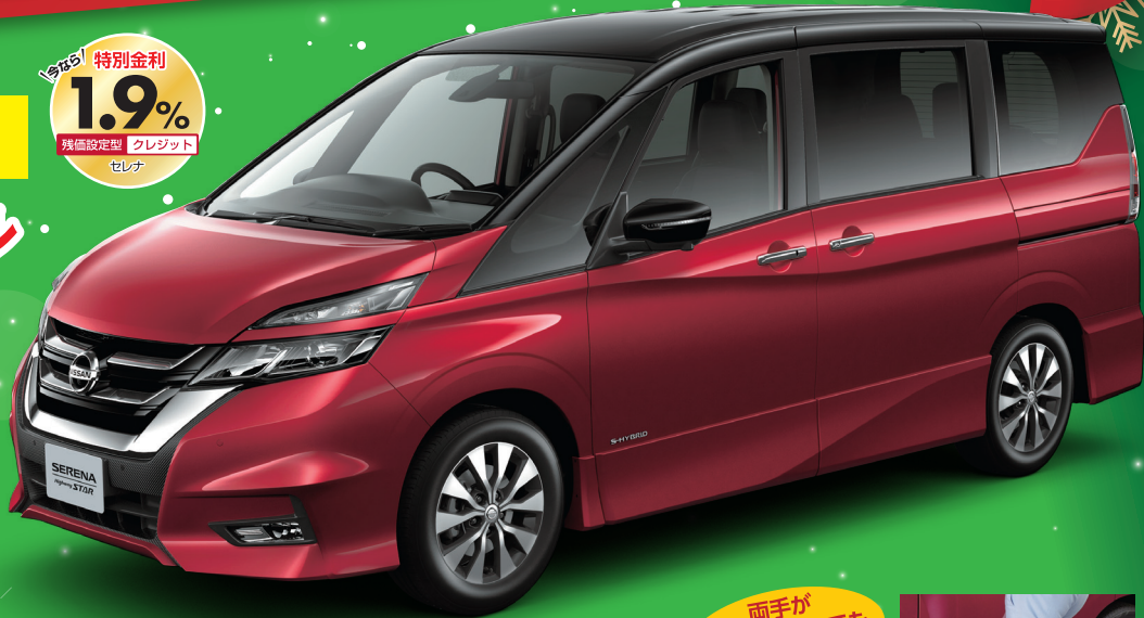
Photo: 浜松日産オリジナル セレナも買得特別仕様車1。ボディカラーはマウンテッド(RPM) / タイタニウムブラック(P) 2トーン(※XANタックラッシュアルル) (特別塗装色 ¥75,600円)。オートデュアルエアコン・寒冷地仕様 (39,960円) はセットでメーカーオプション。セーフティバックA (113,400円) はメーカーオプション。