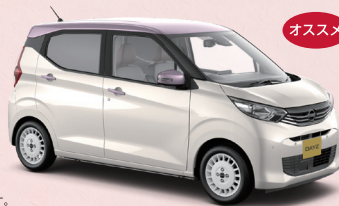
Photo: デイズ ボレロ(2WD)。ボディカラーはホワイトパール(3P)/シルキーライラック(PM) 2トーン (Bolero専用色)(特別塗装色:71,500円)。内装色はモーヴピンク(C)。●「ボレロ」はNMC扱いとなります。

掲載グレード デイズ ボレロ (660 2WD エクストロニックCVT) 車両本体価格 1,600,500円 (消費税抜き価格1,455,000円) ※上記価格には特別塗装色代は含まれておりません。