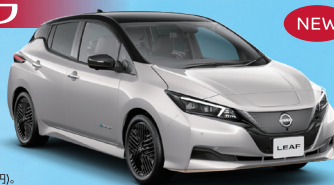
Photo: 日産リーフ e+ X 90周年記念車。 ボディカラーはピュアホワイトパール(3P) スーパーブラック 2トーン(特別塗装色77,000円)。