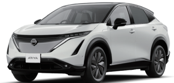
Photo: 日産アリア B6 e-4ORCE。ボディカラーはピュアホワイト(3P)/ミッドナイトブラック(P) 2トーン(特別塗装色93,500円)。